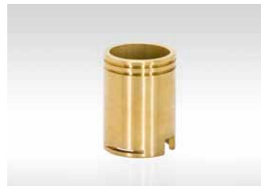
Achse mit Justiermutter; Ø59,5x81mm; Messing (2.0401)