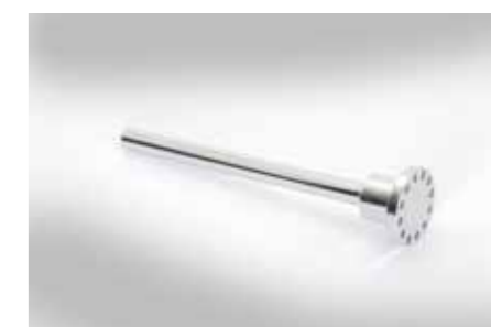
Achse (Ø15x218mm) mit aufgeschr. Flansch (Ø50x33mm); Messing (2.0550) geschl. u. verchr.