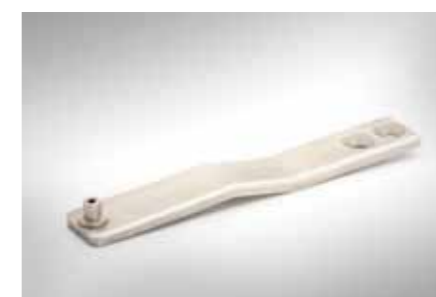
Niederhalter 258x40x8mm, mit eingeschweißtem Bolzen Ø15x22mm; Edelstahl (1.4301)