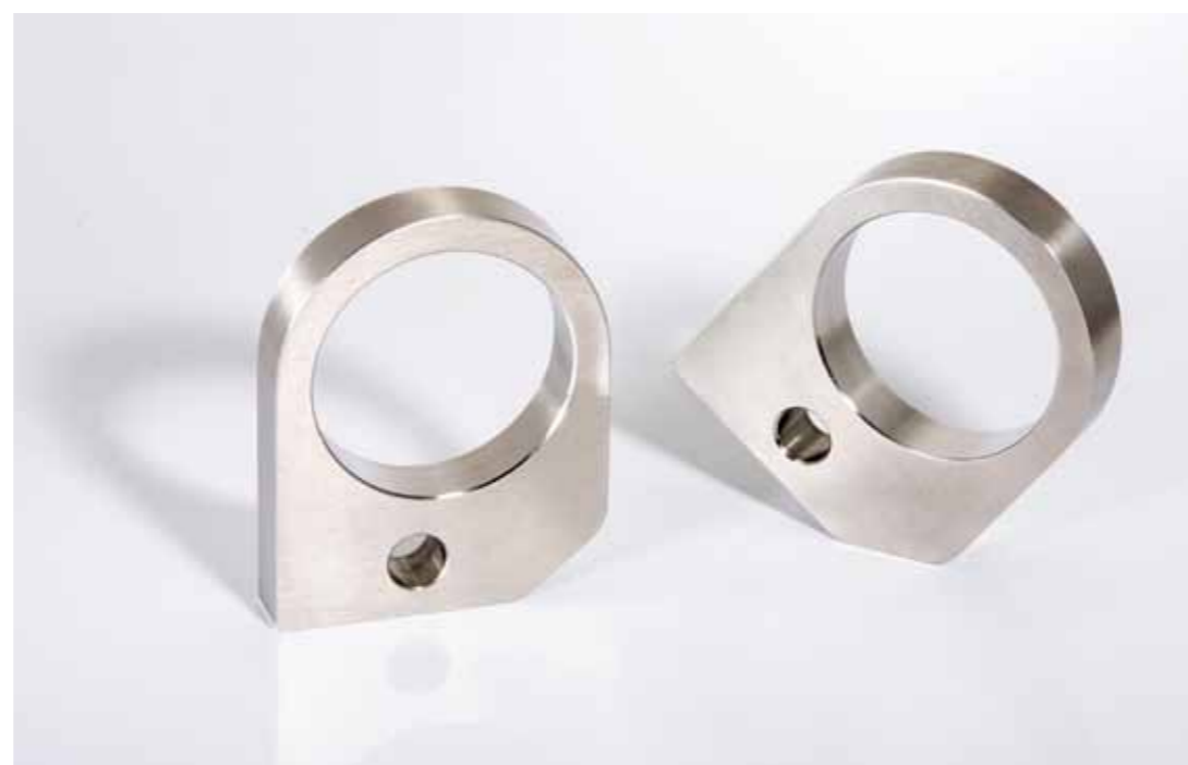
Lageraufnahme, geschliffen; 70x98x15mm; Edelstahl (1.4301)