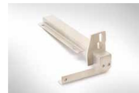
Baugruppe Scharnierlager, gefräst, gekantet und geschweißt; Edelstahl (1.4301)